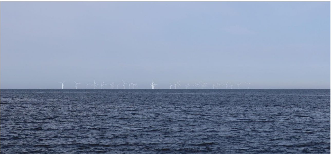
Kuva 13 Mallinnettu näkymä katselupisteestä 5, mereltä koilliseen, suoraan kohti voimalarivejä. Kuvassa on esitetty Raahen ja Pyhäjoen tuulivoimalat.

Viides katselupiste sijoittuu Maanahkiaisien tuulivoima-alueen lounaispuolelle, merelle noin 10 km etäisyydelle rannasta ja noin 10 km etäisyydelle lähimmistä suunnitelluista tuulivoimaloista. Katselusuunta on lähes samansuuntainen kuin tuulivoimalaryhmän lounas-koillinen-suuntaiset rivit. Mereltä kohti koillista katseltaessa, muodostavat Maanahkiaisien tuulivoimalat (Pyhäjoen ja Raahen alueella) laajalle levittyvän, melko yhtenäisen kokonaisuuden (Kuva 13). Tuulivoimalaryhmässä keskimmäisenä erottuva tuulivoimaloiden jono korostuu useiden tuulivoimaloiden näkyessä toisen toistensa edessä. Muodostelman reunoja kohti mentäessä tuulivoimalajonot hajoavat ja muodostavat ryhmän keskellä jonomaisesti ja reunoja kohti jonomaisuus hajoaa (Kuva 14). Pelkät Raahen puolen tuulivoimalat asettuvat näkymässä harvaan, mutta tasapainoiseen muodostelmaan, jossa tuulivoimalat näkyvät keskiosassa jonomaisesti ja reunoilla pareittain (Kuva 15).