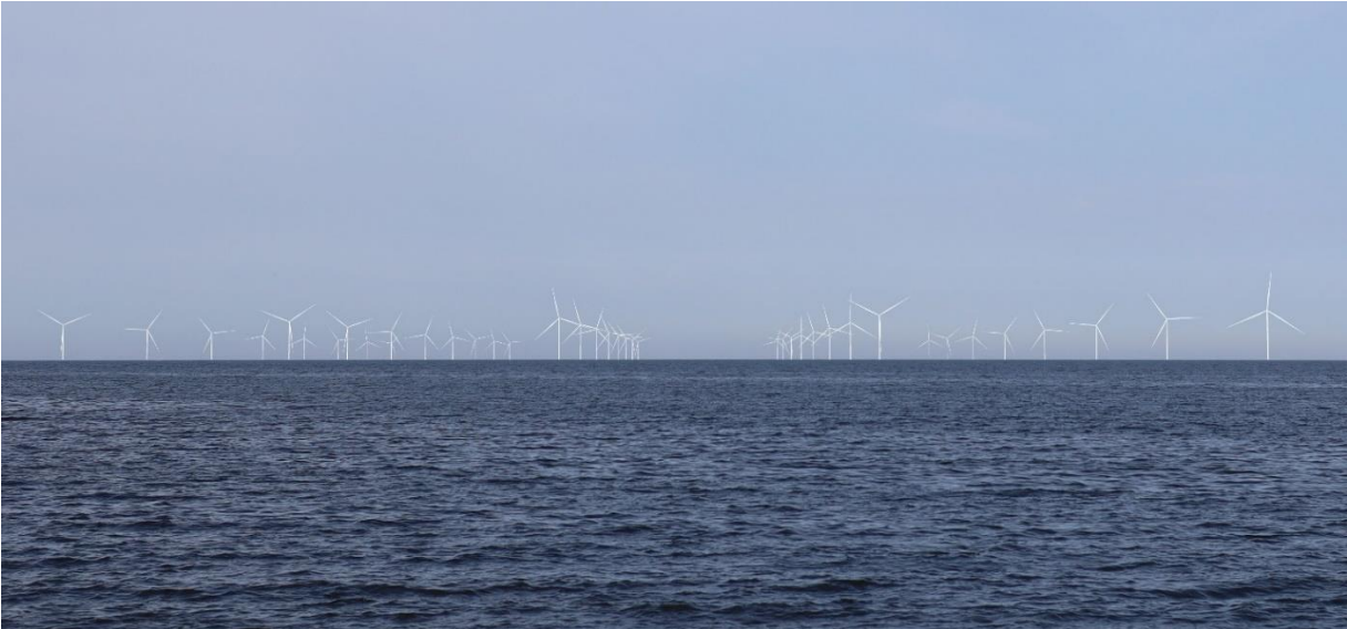
Kuva 7 Mallinnettu näkymä katselupisteestä 3, Hanhikiven edustalta länteen. Kuvassa on esitetty Raahen ja Pyhäjoen tuulivoimalat.