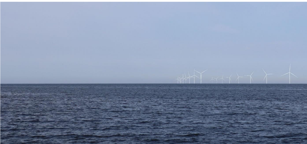
Kuva 9 Mallinnettu näkymä katselupisteestä 3, Hanhikiven edustalta länteen. Kuvassa on esitetty Raahen tuulivoimalat.