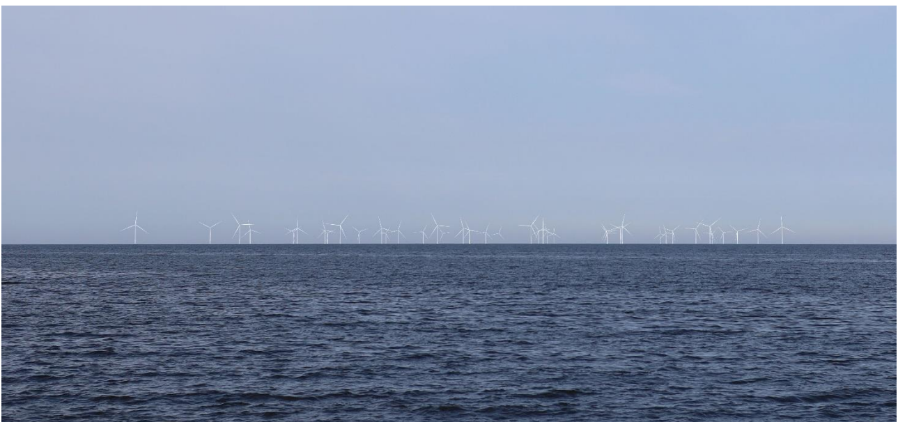
Kuva 4 Mallinnettu näkymä katselupisteestä 2, vesiväylältä lounaaseen. Kuvassa on esitetty Raahen ja Pyhäjoen tuulivoimalat.

Toinen katselupiste sijoittuu Raahen edustalta lounaaseen / länteen suuntautuvalla vesiväylällä noin 9 km etäisyydelle Raahen rannikosta ja noin 8,3 km etäisyydelle lähimmistä suunnitelluista tuulivoimaloista. Vesiväylältä lounaaseen katseltaessa, muodostavat Maanahkiaisen tuulivoimalat (Pyhäjoen ja Raahen alueella) laajalle levittyvän, mutta melko yhtenäisen kokonaisuuden (Kuva 4). Katselupisteestä nähtynä mikään tuulivoimalajonoista ei erotu täysin kohtisuorana, mutta ryhmän keskiosan länsipuolella ryhmä on harvempi ja jonomaisempi kuin muilta osiltaan. Pelkästään Pyhäjoen tuulivoimalat erottuvat näkymässä harvana, melko laajana ryhmänä, jossa keskivaiheen länsipuolella jonot korostuvat (Kuva 5). Pelkät Raahen puolen tuulivoimalat asettuvat näkymässä hieman epätasaiseen, harvaan riviin, jossa roottorit näkyvät hieman limittäin tai jonomaisesti muodostelman länsiosissa (Kuva 6).