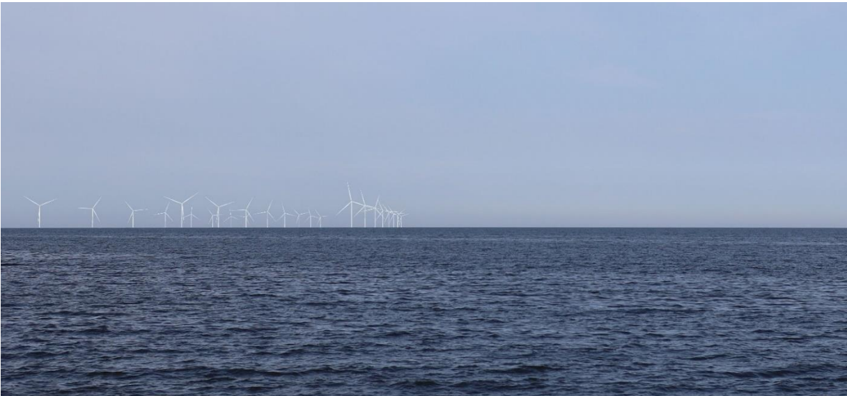
Kuva 8 Mallinnettu näkymä katselupisteestä 3, Hanhikiven edustalta länteen. Kuvassa on esitetty Pyhäjoen tuulivoimalat.