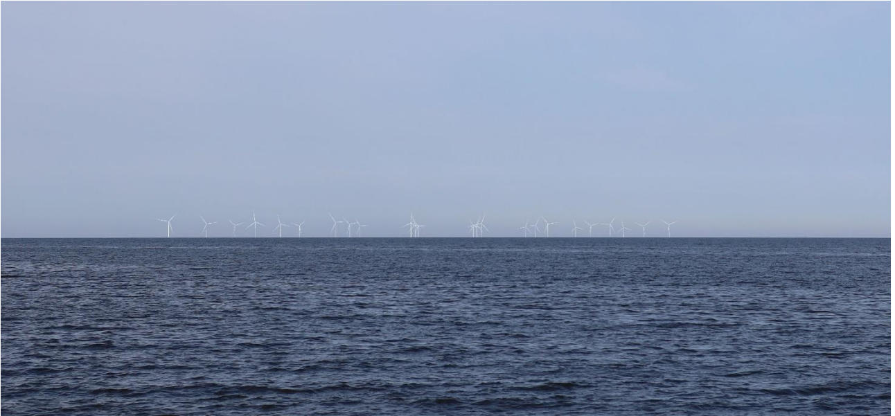
Kuva 14 Mallinnettu näkymä katselupisteestä 5, mereltä koilliseen, suoraan kohti voimalarivejä. Kuvassa on esitetty Pyhäjoen tuulivoimalat.