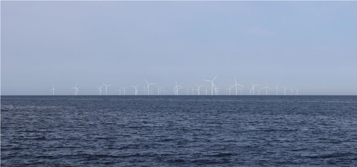
Kuva 16 Mallinnettu näkymä katselupisteestä 6, vesiväylältä itään. Kuvassa on esitetty Raahen ja Pyhäjoen tuulivoimalat.