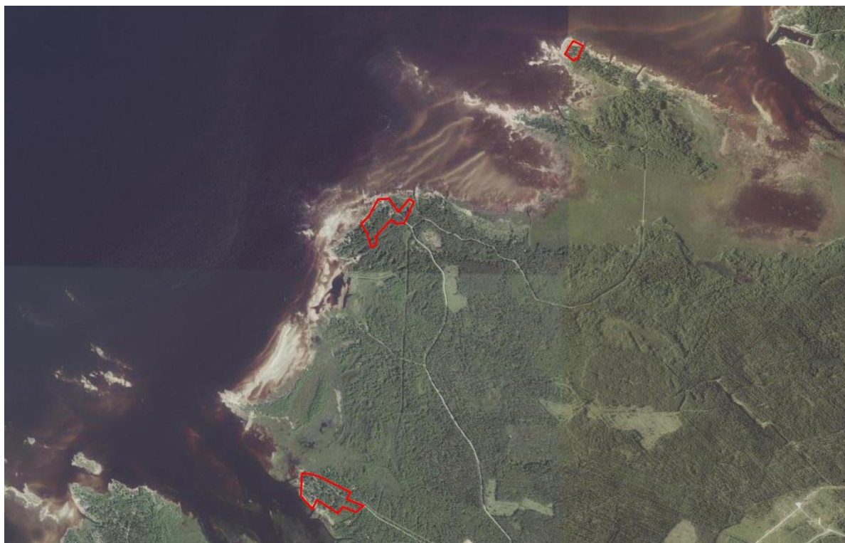
Kuva 1. Ilmakuva suunnittelualueesta ja lähiympäristöstä. Kaava-alueen alustava raja on osoitettu punaisella viivalla. (Lähde: Maanmittauslaitos).